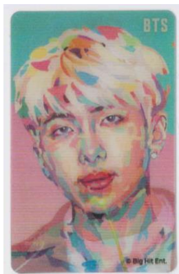
レンチキュラー タイプ